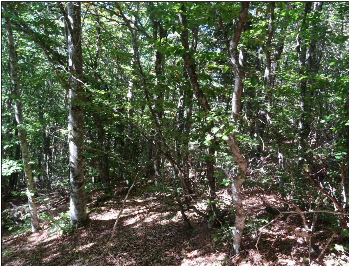
Hêtraie du Suc de Breysse

Le site est composé de deux sucs : le petit et le grand suc. La superficie de ce Natura 2000 est de 118,46 Ha. Le premier document d'objectifs a été validé en comité de pilotage en 2011.