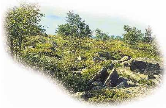
Lande à Myrtille et Callune