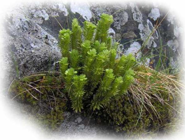
Huperzia selago L. (Lycopode sélagine)